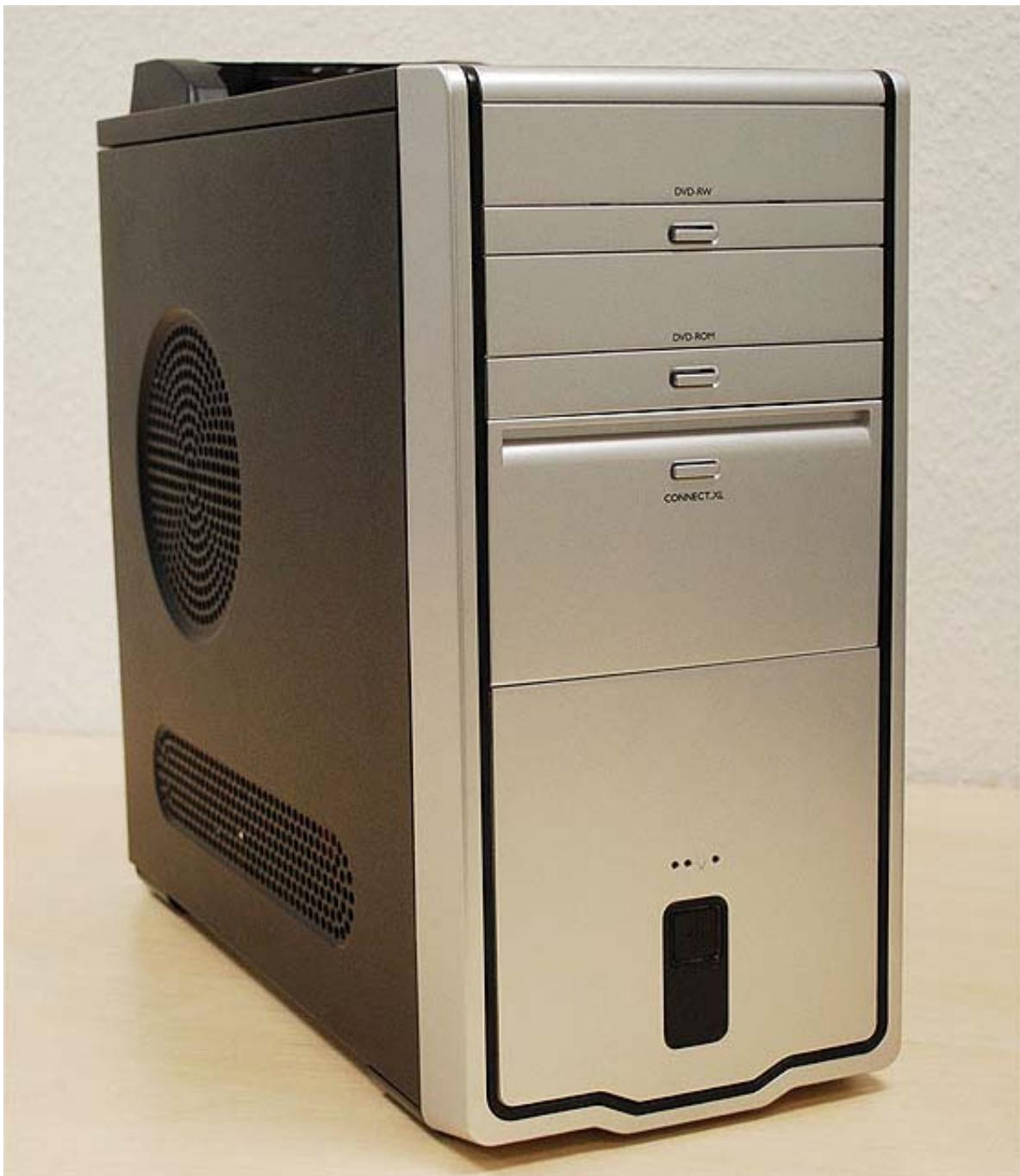
(Abb. 8 – Die Farbe der Frontblende kann variieren)

Wenn alle Schritte durchgeführt wurden, sieht das Ergebnis wie auf Abbildung 8 aus.